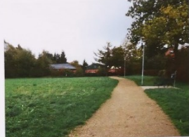
Blick auf vorhandenen Sitzplatz und Festwiese