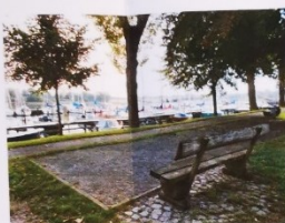
Boulebahn mit Sitzplatz an einem Wanderweg