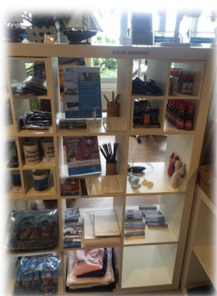
Jetzige Auslage regionaler Produkte in der Tourist-Info Eckernförde

Gäste erwarten zunehmend mehr, wenn sie eine Tourist-Info aufsuchen oder aber sich vorab im Internet über eine Urlaubsregion informieren. Neben den Erholungsmöglichkeiten wolle Gäste auch das regionstypische erleben, Kultur- und Naturangebote wie auch regionale Produkte und Dienstleistungen. Um den zukünftigen Anforderungen gerecht zu werden, hat die Eckernförde Touristik & Marketing GmbH daher eine umfassende Modernisierung ihrer Räumlichkeiten in Planung, die von der AktivRegion gefördert wird. Zum einen geht es um die Modernisierung der Tourist-Info zu einem Welcome-Center mit dem Ziel, mehr Mitarbeiter unterbringen zu können, durch eine Leichtbauwand einen Rückzugsbereich für Back-Office Arbeiten zu schaffen, einen angemessenen Empfangs-counter und eine Optimierung der IT an die gestiegenen Ansprüche an die Tourist-Info zu verwirklichen. Das alles führt zu einer Leistungssteigerung und einer verbesserten Versorgung und Betreuung der Kunden.