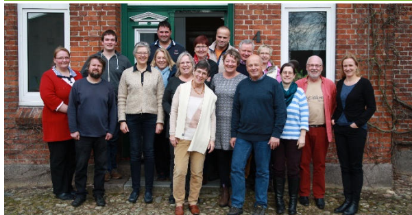
Teilnehmer des Nachtreffens vom März 2016

Das erste Vorbereitungstreffen der Akteure hat am Mittwoch, den 12. Oktober im Amt Hüttener Berge stattgefunden. Viele Teilnehmer von der IGW 2016 waren dabei, aber auch einige neue Gesichter konnten begrüßt werden. Weiterhin können sich alle Interessierten, die sich für die Region mit Ihren Produkten oder Angeboten präsentieren möchten, bei uns melden ( igw@aktivregion-hao.de ). Eine maritime Ergänzung zum Thema Fisch und Fischerei wäre besonders schön, waren sich alle Teilnehmer einig. Neu in Planung ist ein Angebot unserer Akteure und insbesondere der außerschulischen Lernorte für Berliner Schulklassen vormittags ein Mitmach-Lernprogramm im Bereich Landwirtschaft und