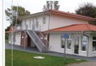
Wellness-Center in Surendorf