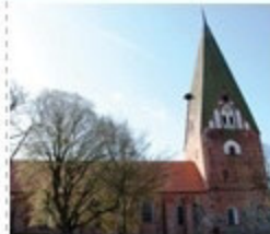
Konzertkirche in Gettorf