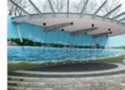
Konzertmuschel in Eckernförde