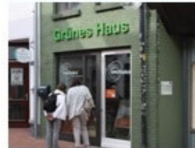
Grünes Haus in Eckernförde